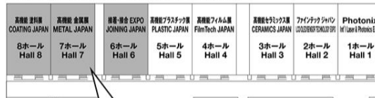
< 幕張メッセ 全体図 Makuhari Messe >