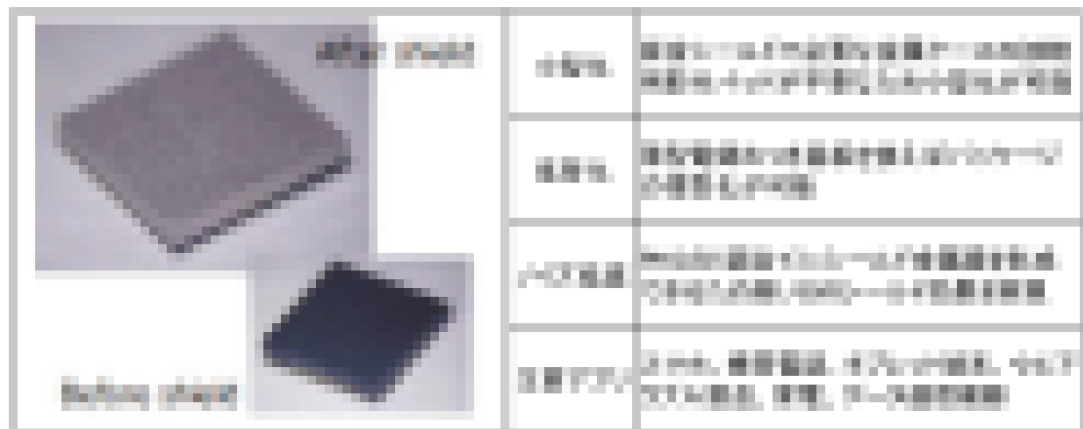
図12. アライメント調整のための導電性塗料の塗布

この塗料は、導電性樹脂を主成分とし、導電性粒子を分散させた塗料で、中密度から高密度、高導電性から低導電性まで幅広い性能を有している。また、導電性粒子の分散状態によって、導電率を調整することができる。また、導電性粒子の分散状態によって、導電率を調整することができる。また、導電性粒子の分散状態によって、導電率を調整することができる。